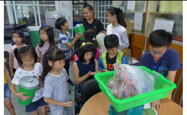
108年5月的每週三早自習為〈班級廢乾電池秤重日〉