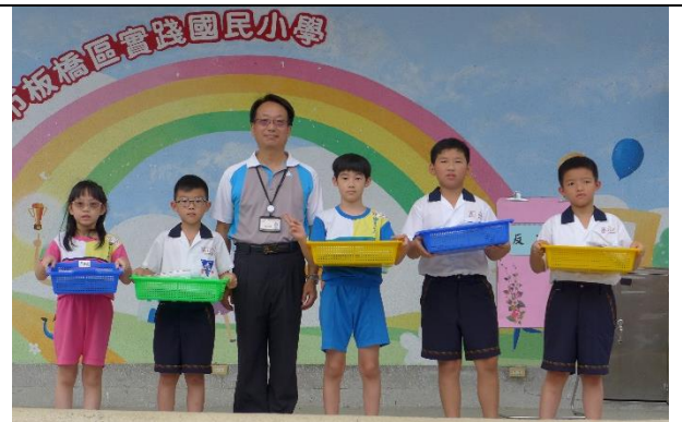
6/3(一)於學生朝會進行班級廢電池回收競賽頒獎